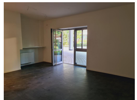
Ladenfläche mit Blick zum Ausgang