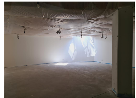
allgemeine Fläche 120m 2