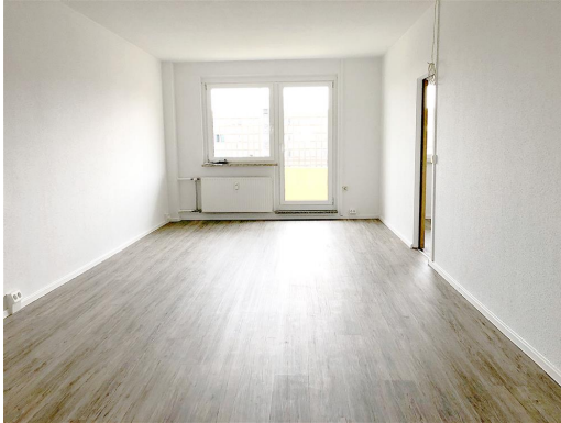
Küche - Wohnzimmer

Angebots-ID: 31684-207 08058 Zwickau Moseler Str. 10