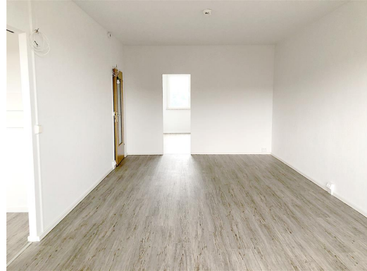
Küche - Wohnzimmer